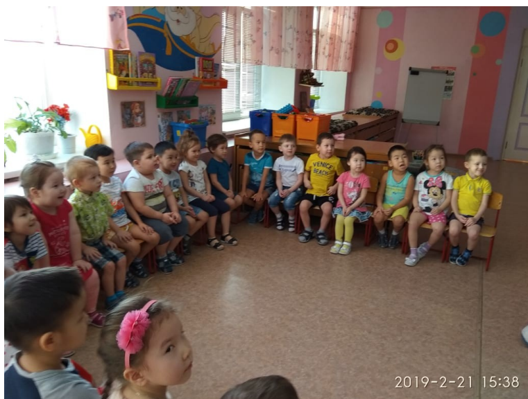
Беседа «Что я знаю об армии»

Выставка совместных работ по теме «Поздравляем наших пап».